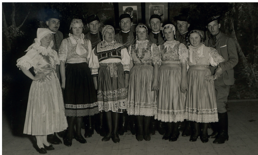
Obr. 6: SOKOL Piešťany – ľudová hudba, 30. roky 20. storočia.