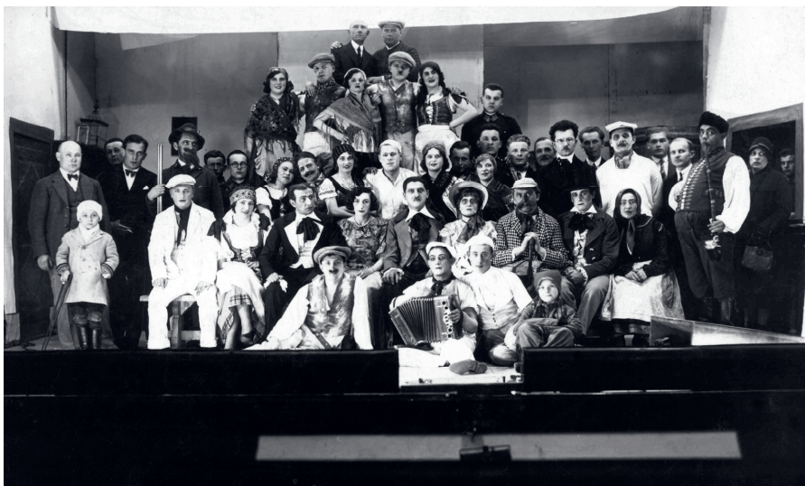
Obr. 4: Divadelná hra Z českých mlynov, rok 1931.