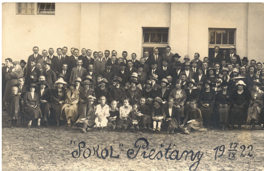
Obr. 2: TJ SOKOL Piešťany, skupinová fotografia, rok 1922.