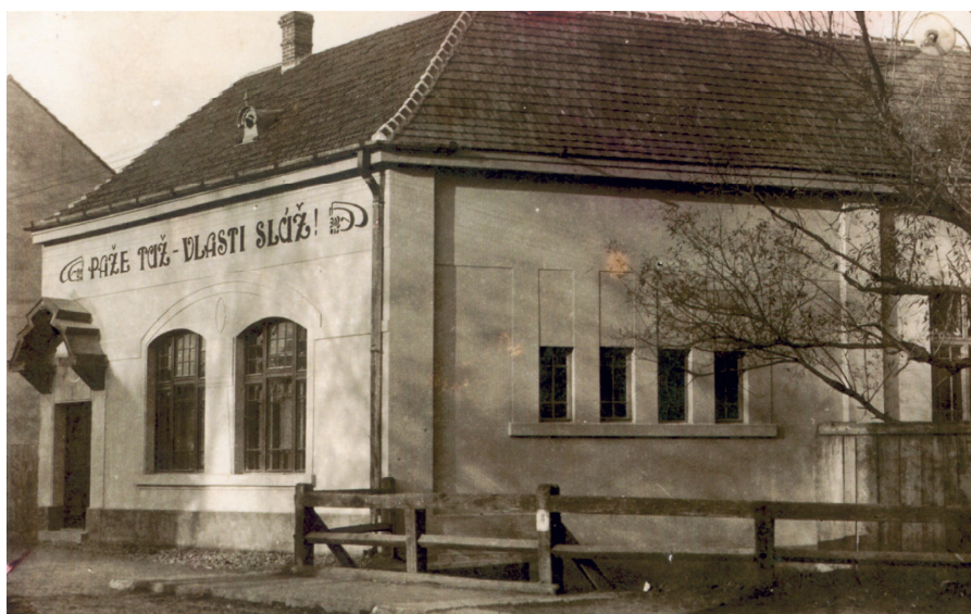
Obr. 1: Piešťanská sokolovňa bola slávnostne otvorená 17. septembra 1922. Bola postavená na dnešnej Teplickej ulici. Už nestojí. Čiernobiela fotografická pohľadnica.